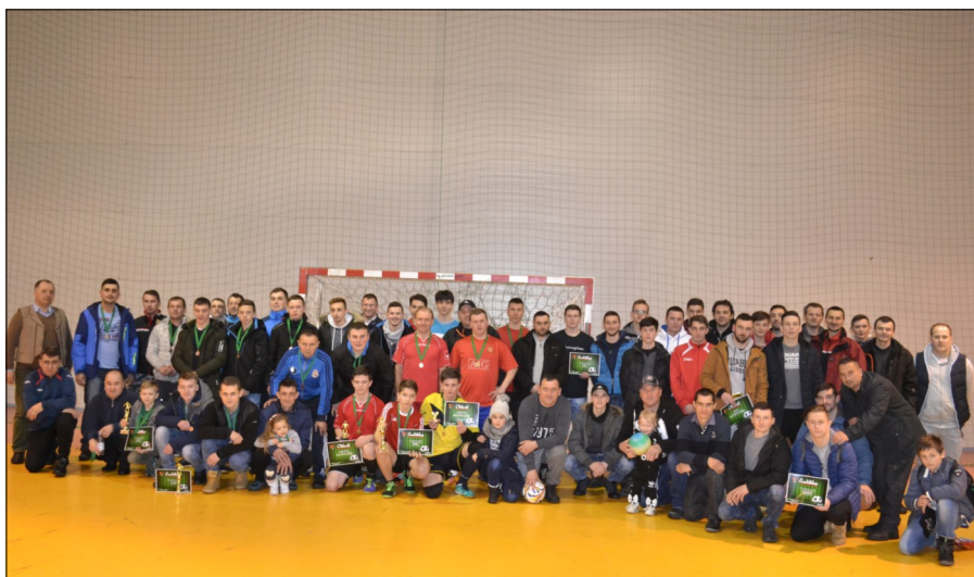
« Fordulatos mérkőzések eredmények, győztesek - a vetélkedés ellenére a lényeg a barátságos játék és –hangulat.