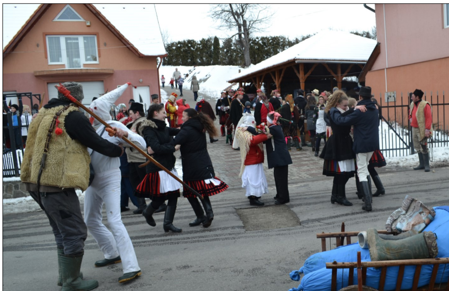
« Helyi és megyei farsangbúcsúztatók után értékes hagyományörző rendezvényeket tudhatunk magunk mögött.

nis a Csutakfalváiért Egyesület is farsangi bált szervezett a község legnyugatibb részén lakói számára illetve Gyergyóremete adott otthont a Gyergyó-medence idősei számára szervezett farsangi bálnak is.