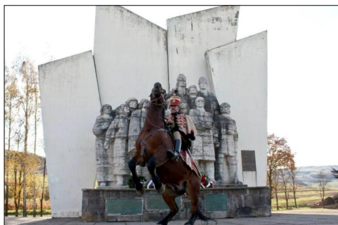
« Az 1848-as Székely Nemzeti Gyűlés emlékműve Agyagfalván

170 éve, 1848. március 15-én kezdődött a magyar szabadságharc és forradalom. Március 15-én, csütörtökön kora délután a pesti Nemzeti Múzeum előtt sok ezer ember gyűlt össze. Ismertetésre került a „Mit kíván a magyar nemzet” kiáltvány a forradalom programjával, Petőfi elszavalta a Nemzeti dalt (Talpra magyar...). A délelőtti csipős szél és havas esős időjárás ellenőre, az időpont jól volt rögzítve, mivel ez volt a pesti heti nagyvásár napja Rákosmezőn (ma itt van a Ferencváros stadionja és a népliget autóbusz állomása). Ilyenkor Ceg-