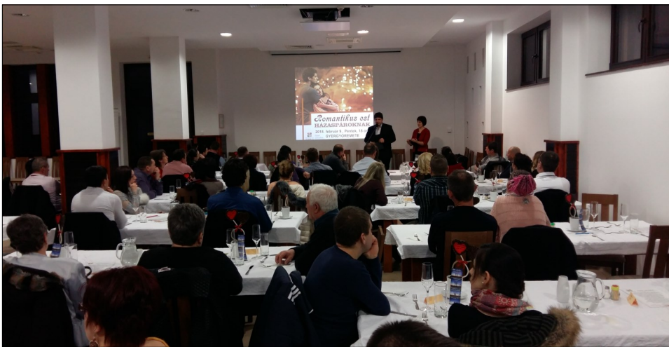
« Romantikus est keretében, bensőséges hangulatban ünnepeltek a házaspárok a csutakfalvi közösségi házban.

Ezen az estén lehetőségünk nyílt lecsendesni a hétköznapi forgatagából és minőség időt szentelni egymásnak. Biztattak arra, hogy kéz a kézben, imával is koronázzuk meg