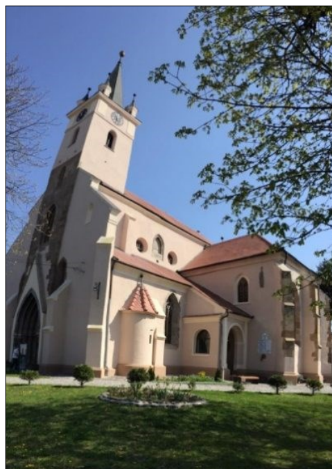
« A szászrégeni evangélikus templom a ferde tomyával

lás volt, amiért hosszú évtizedeken át a régeni szász kereskedők a gyergyói tulajdosokat becsapták, a megalkudott árat nem adták meg, tutajajukat feltartóztatták a Maroson és csak úgy engedték tovább, ha deszkát, zsindelet, borvizet adnak.