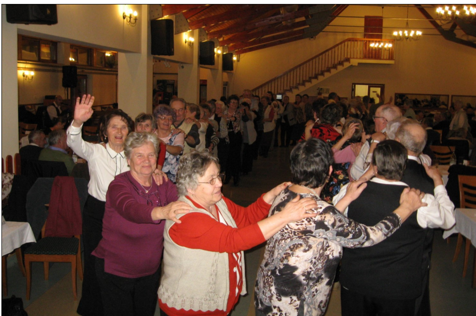
« A táncos mulatság alkalmával újra egymásra találtak régi munkatársak, ismerősök, barátok.

kiderítettük, hogy a több, mint kétszáz lélekföből hányan ünnepelik a születésnapot. A kedves születésnaposokat méltóképpen felköszöntöttük, majd ezt követően „szabad a tánc” jelszóval elkezdődött az igazi mulatság, ahol egymásra találtak régi munkatársak, ismerősök, régi-új szimpátiák, egyszóval egekig