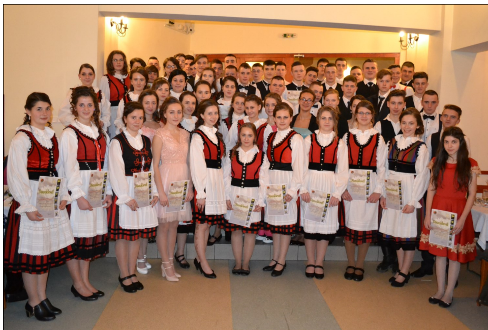
« A 2000-ben születettek nagykorúsítása - csoportkép az ünnepélyes eskütétel és a díszoklevelek átvétele után.

felelősek a multság hangulatáért. A buli hajnal 5 óra környékén fejeződött be.