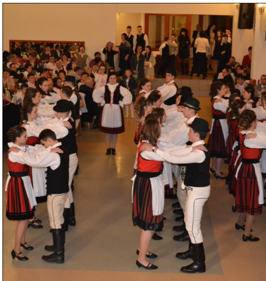
« Nagykorúsítottak ünnepélyes bálí nyitótánca.