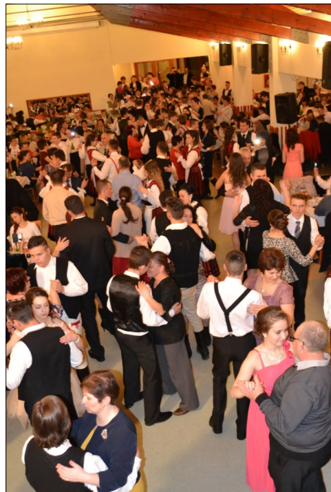
« Báli kezdőtáncan anya fiával, apa lányával.