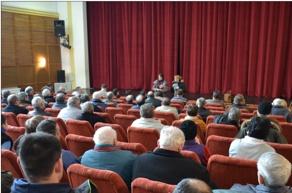
«Mostantól kezdődően május 15-ig adhatják le a gazdák kéréseiket a mezőgazdasági területalapú és állattámogatásokra.