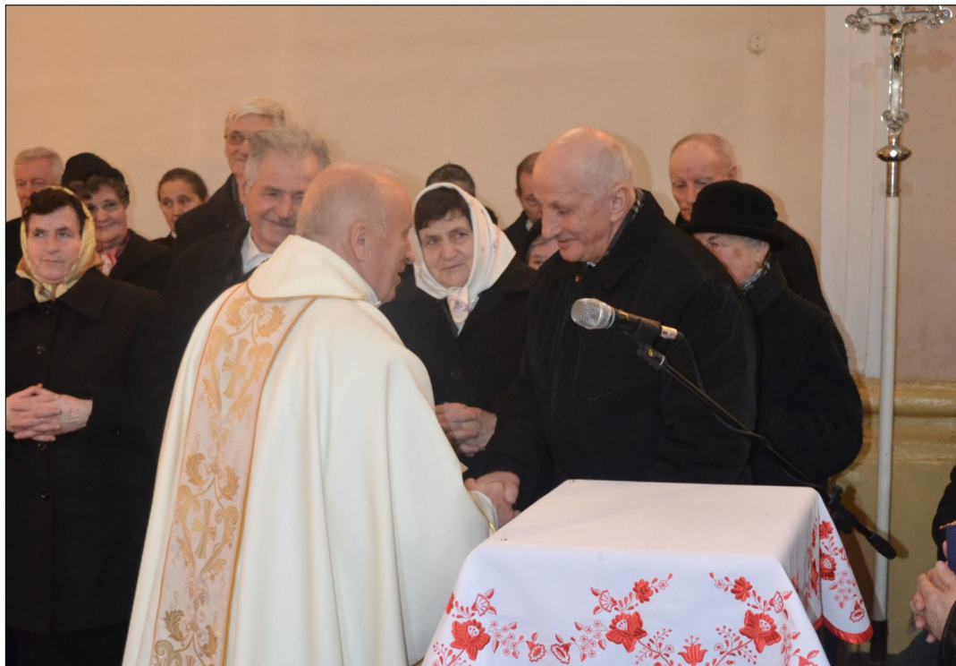
« A hagyomány szerint a házassági évfordulók megünneplésekor kitüntetett figyelemben részesülnek az 50 és a 25 éves jubilálók.