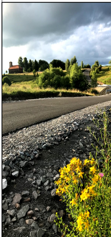
« Kicsibükki felé vezető úton.