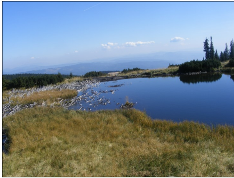
« Kelemen – havasok: Jézert - tó (Bánffy - tengerszem)

A hercegnő megparancsolta fiainak, hogy űzzék ki a betolakodókat.