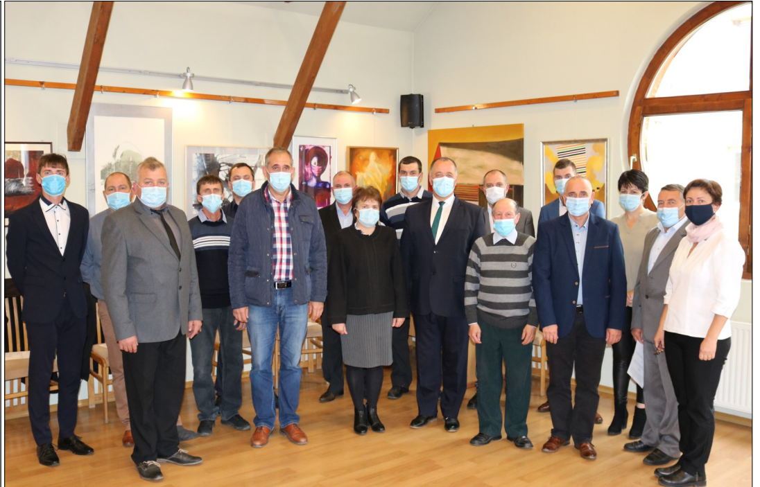
« 2020. október 28-án megalakult Gyergyóremete Község Önkormányzata.