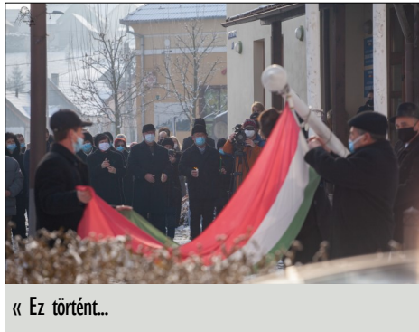
« Ez történt...

Most, amikor idehívtuk Önöket, akkor a bukaresti Ítéltábla végleges