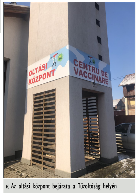
« Az oltási központ bejárata a Tűzoltóság helyén

A víz- és csatornahálózat kiépítésére vonatkozó pályázatot újra terveztük. Az új tervekben nagyobb