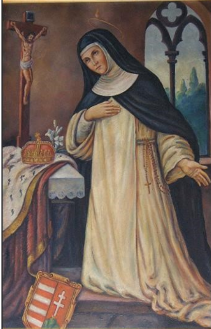
« Árpád-házi Szent Margit, könyörögi érettségünk!