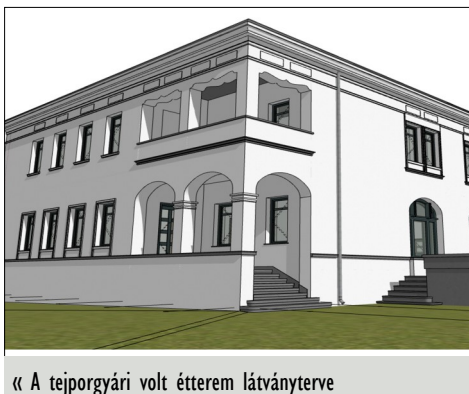
« A tejporgyári volt étterem látványterve

most aszfaltozásra kerülő szakaszán pedig, lefektették a gázvezeték. Terveket készítettünk annak érdekében, hogy a fel legyen készülőve az újabb pályázati kiírásokra a községünk.