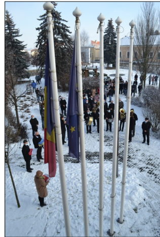
« ... Nem marad így!

Mi úgy látjuk és úgy gondoljuk, meggyőződésünk, hogy senkit nem sértünk, senkit nem bántunk azáltal, hogy a nemzeti szimbólumaink itt vannak és itt lehetnek. A zászlókat levonjuk, a bírósági határozatot betartjuk, nem értünk egyet – hangsúlyozzuk – és mi maradunk. A lényeg nem változik. Nyugalomra, türelemre, hitre, reményre, valamint munkára és összetartásra biztatok minden remetei embert!