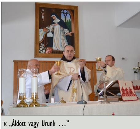
« „Áldott vagy Urunk ...”